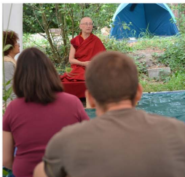
Des enseignements bouddhistes le matin

Les participants sont invités à partager le silence du réveil jusqu'au repas de midi.