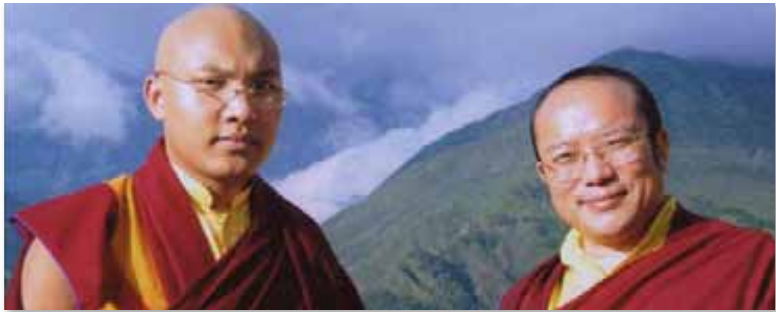
Le 17 ème Gyalwang Karmapa