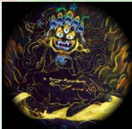
Mahakala peint par le 17 ème Karmapa