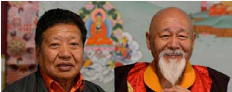
Tcheudjé Akong Tulkou Rimpotché